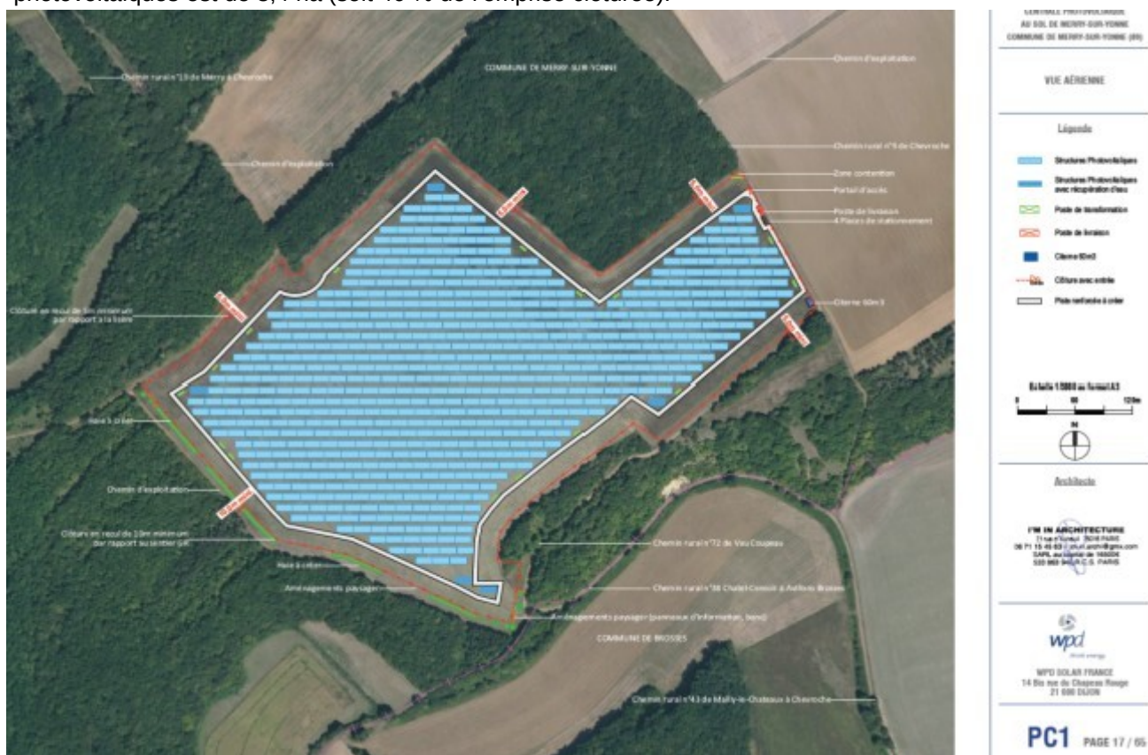
Plan d'implantation du projet (cf. p.17 du dossier de demande de permis de construire)

Le projet s'étend sur une emprise clôturée de 18,31 ha, sur les parcelles cadastrales n°ZI0020, ZI0021 et ZI0022 qui feront l'objet d'un bail emphytéotique avec le propriétaire privé. Elles représentent 11,9 % de la surface agricole utile (SAU) de l'exploitation agricole concernée. La surface au sol couverte par les panneaux photovoltaïques est de 8,4 ha (soit 46 % de l'emprise clôturée).